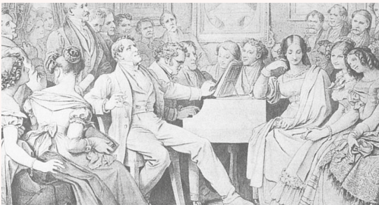
Drawing of a Schubertiade by Moritz von Schwind, 1865.

Although he was a shy person, Schubert was constantly in the company of friends, all artists and lovers of literature. This group of young eccentrics nicknamed him "Schwammerl" (which signifies mushroom), due to his short and stout build. They housed him and actively promoted his music, even after his death.