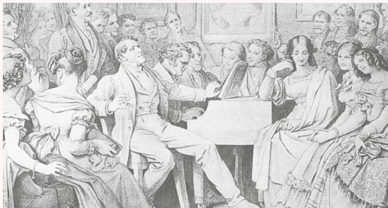
Dessin d'une Schubertiade par Moritz von Schwind, 1865.

Bien que timide, Schubert était constamment entouré d'un cercle d'amis : tous artistes et passionnés de littérature. Ce groupe de jeunes excentriques l'appelaient taquinement « Schwammerl » (« champignon »), en raison de sa petite taille et sa corpulence. Ils l'hébergeaient et promouvaient sa musique très activement, avant comme après sa mort.