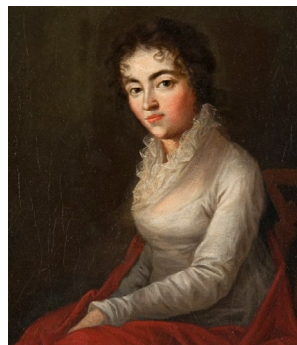
Constanze Mozart, par Joseph Lange, 1782.

Peu de temps après, à l'été 1782, des rumeurs sur sa proximité avec l'une des filles des Webers lors de son séjour chez eux le poussèrent aux fiançailles. Son mariage avec Constance est heureux et ils auront leur premier enfant en juin 1783. Ainsi, entre 1781 et 1783, Mozart a changé d'emploi, déménagé, s'est marié et a eu un premier enfant. Son mariage, qu'il annonce à son père par courrier sans lui laisser le temps de répondre, rend son père furieux. Après plusieurs annulations contrariantes pour son père, un voyage à Salzbourg a enfin lieu pour lui présenter Constance. C'est lors de ce voyage, très stressant pour Mozart, qu'il écrit le duo.