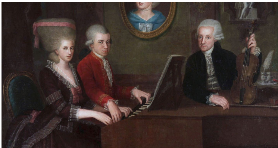
The Mozart family , by Johann N. della Croce..

Wolfgang Amadeus Mozart (1756-1791) was born in Salzburg, now a city in Austria but at the time a principality of the Holy Roman Empire. His father was a musician and composer at the court of the Prince Archbishop of Salzburg. He taught music to Wolfgang and his older sister Maria Anna when they were very young. They were virtuosos who spent their childhood travelling from one royal court to the other with their father, showing off their talents. Mozart wrote the String Duo No. 1 , a piece for violin and viola, in 1783 during his early years in Vienna. The transition from Salzburg to Vienna was an eventful period in his life.