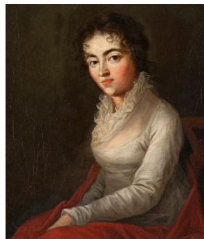
Constance Mozart, by Joseph Lange, 1782.

Shortly afterwards, in the summer of 1782, rumours about his relationship with one of the Webers' daughters during his stay with them pushed him to get engaged. His union with Constance was a happy one, and they had their first child in June 1783. Between 1781 and 1783, Mozart had changed jobs, moved house, married and had his first child. His wedding, which he announced to his family by letter without giving enough time to reply, infuriated his father. After several insulting cancellations, a trip to Salzburg finally took place to introduce Constance to him. It was during this stressful trip that Mozart wrote the duet.