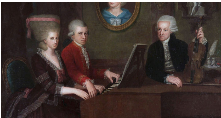
La famille Mozart, par Johann N. della Croce.

Wolfgang Amadeus Mozart (1756-1791) est né à Salzbourg, aujourd'hui ville d'Autriche, mais à l'époque principauté du Saint-Empire romain germanique. Son père est musicien et compositeur à la cour du prince-archevêque de Salzbourg. Il enseigne la musique à Wolfgang et sa grande sœur Maria Anna alors qu'ils sont très jeunes. Ce sont des virtuoses qui passent leur enfance à voyager d'une cour royale à l'autre avec leur père, pour montrer leurs talents. Mozart écrit le Duo pour cordes n°1 , pièce pour violon et alto, en 1783 alors de ses premières années à Vienne. La transition de Salzbourg à Vienne est une période mouvementée de sa vie.